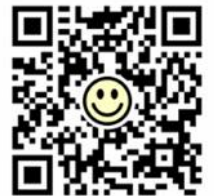
ブログQRコードです↑

また、最近はメイプルの活動・雰囲気をもっと発信していきたい、知ってもらうためにブログの更新も頑張っています。ブログにはパンフレットには掲載しきれないメイプルの作業内容についての詳しい説明や行事・イベントの様子について投稿しています。お菓子作り体験会の案内もブログに掲載しています。是非のぞいてみてください！(中村)